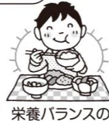
栄養バランスのとれた食事と水分