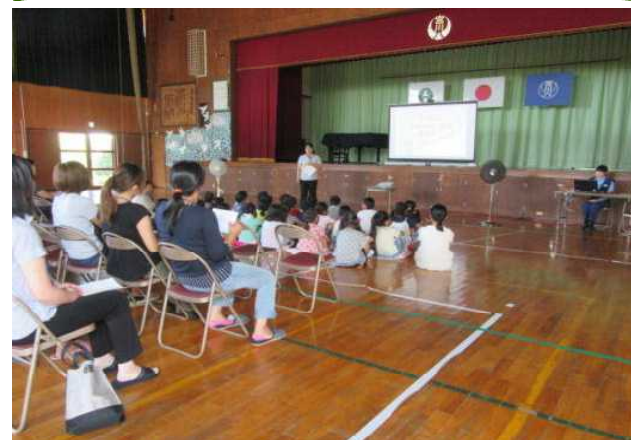
9/13 1年生PTA学年活動 「親子 防犯教室」