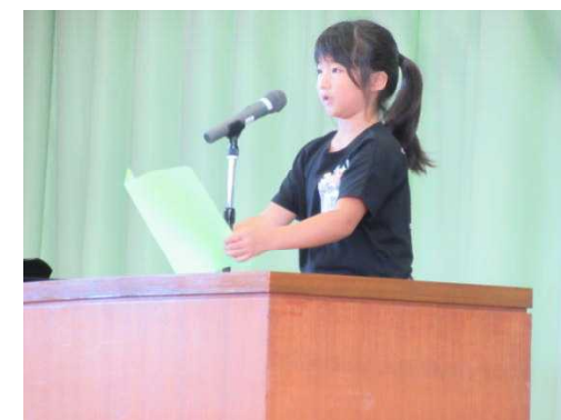
9/1 始業式 2学期の目標発表 具体的な目標が言えました