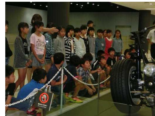
9/22 5年生社会科見学 自動車工場（富士重工業）