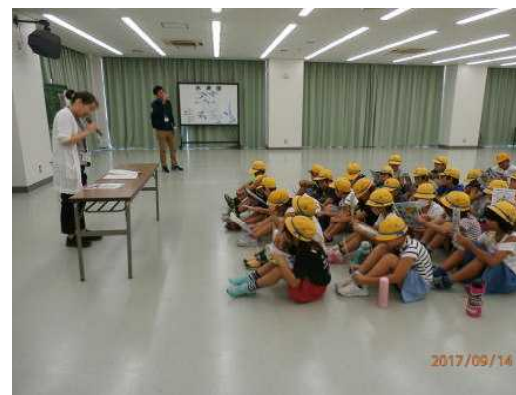
9/14 4年社会科見学 庄和浄水場にて 水道水を安心して飲める仕組みが わかりました。