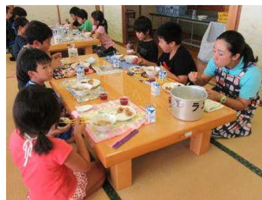
和室ランチルーム会食 3年2組